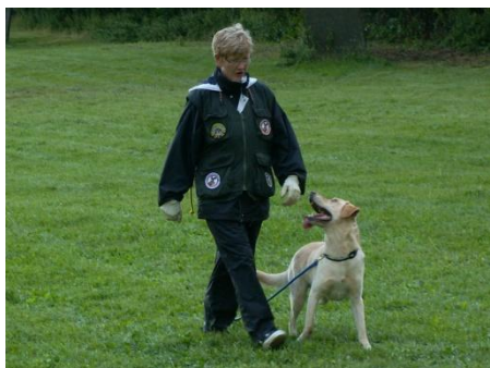
Sikken en kontakt