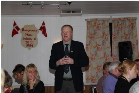
Formanden bød velkommen til alle

Da tilslutningen til den årlige fest har været voldsomt dalende de senere år og måtte aflyses sidste år, var der en hvis spænding i år.