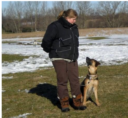
Skal vi snart lave noget???

Nu hvor jeg er blevet større, hedder jeg oftest "DyyyyygtigNova" eller "Weeeeeee" – faktisk kan jeg bedst lide når jeg hedder "Weeeeeee". Det giver sådan en god følelse, og så løber jeg hjem til min mor. Weeee Vind I Hår, og så må man gerne blive lidt fjollet.