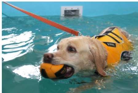
En meget afslappet Bongo i bassinet