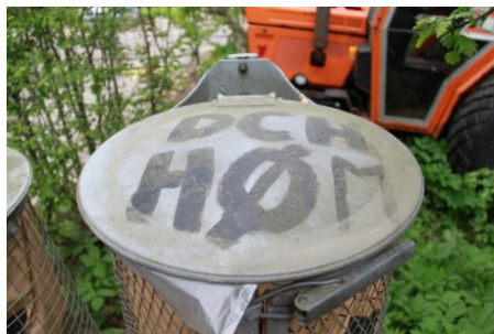
Skraldespand til lorteposer. Kan findes ved klubhuset.