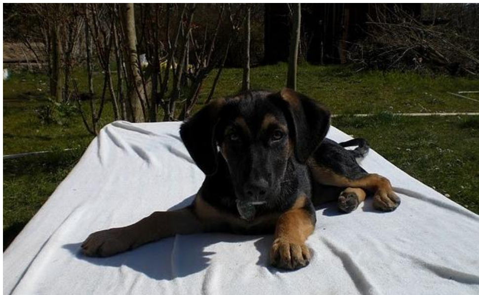
Nova som hvalp. Søøøød vovse