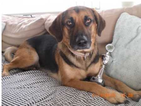
En prinsessemås med én af sine mange pokaler