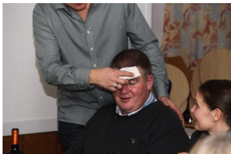
Kassereren blev tørret løbende på panden

De små grå – hjernecellerne – kom også på arbejde, da der var lavet en "DCh-tip en 13'er" med diverse spørgsmål om klubben og hunde.