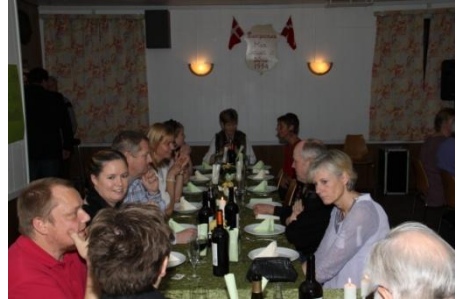
Snakken gik rundt om bordet.

mange timer, var der forskellige festlige indslag, som involverede de allerfleste af deltagerne.