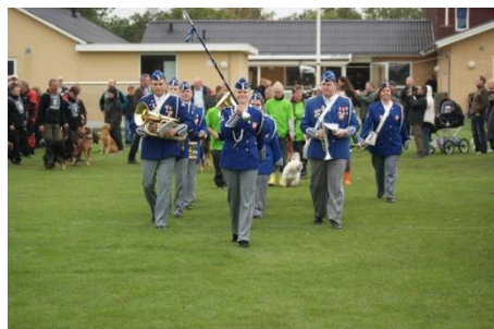
Indmarch til præmieoverrækkelsen