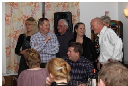
Klar til dyst...

en ekstrem varme, der meget hurtigt fyldte lokalet, tror jeg, alle hyggede sig. Snakken gik i hvert fald overalt, hvor jeg kiggede hen, hvilket også ses på billederne, jeg tog i løbet af aftenen.