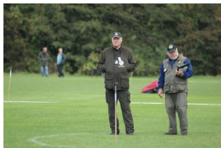
Vores formand var dommer i eliteklassen