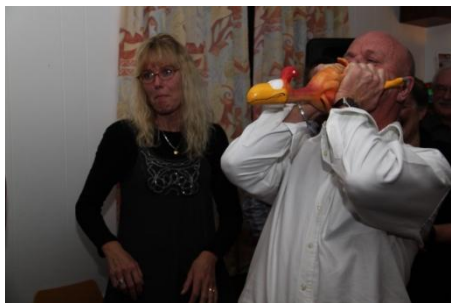
Genoplivningsforsøg af pivedyr...