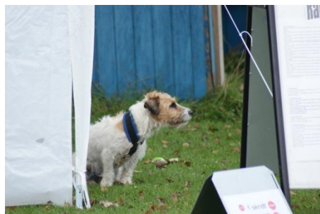
Gizmo holder vagt ved Rally workshoppen