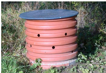
Dette rør er ikke beregnet til lorteposer men er et skjul til figuranter.