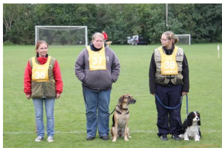
Miki og Nova (i midten) venter på resultater til DM

Ligeledes var udmarchen noget af et circus. Her var alle hundene også med. Og selvom Nova havde brokket sig over de lange perioder i bilen hele weekenden, så tror jeg nok lige, hun ønskede sig tilbage i bilen igen, da først de begyndte at slå på tromme, og hun skulle gå fint på plads mellem alle de andre hunde. Hun var ikke ret stor.