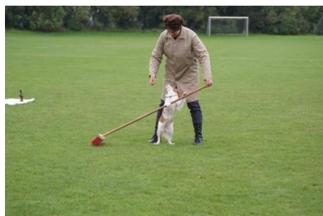
Opvisning i Dog Dancing