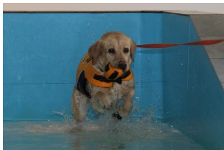
Klar, parat, spring...