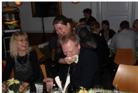
Formanden blev tørret grundigt om munden af fruen.

Det forlød, at en lille håndfuld af den "hårde" kerne festede igennem til hen på morgenen.