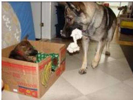
Skal vi lege??? Fister og Siggie