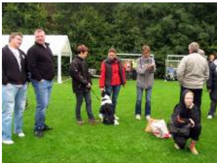
De to tosser sammen med flere supportere.

selskab. I det hele taget er stemningen til et DM altid helt speciel. Alle er glade, og alle snakker med hinanden.