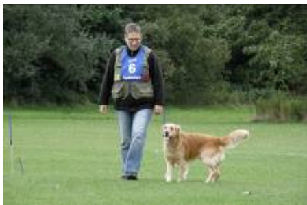
Jeanette og Zorba blev nummer 10