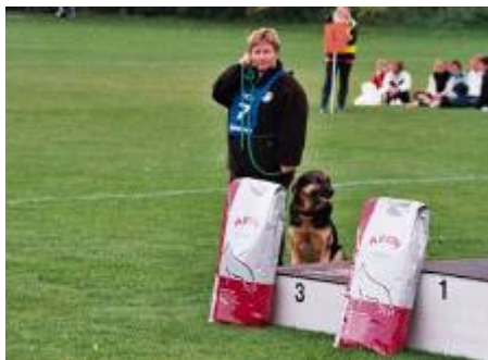
Øhhhh hvad skete der så lige her???

Endnu større var glæden, da speakeren råbte mit nummer op og bad mig om at træde hen til podiet. Mange tanker fløj igennem hovedet på mig, men spørg mig ikke den dag i dag, hvad jeg egentlig tænkte, da jeg stod side om side med de to andre, som også skulle på podiet.