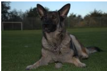
Fister er altid klar til at lave noget.

Nå, efter 7 år uden hund efter en trafikulykke, hvor jeg måtte sælge min 3-årige Schæferhund til politiet, var jeg 'moden' til at få hund igen. Mine børn var ved at få 'spat' af, at jeg altid skulle kæle med de hunde vi mødte.