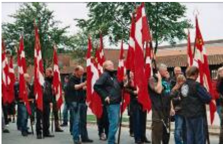
Formanden i aktion som fanebærer

Faktisk var der yderligere en lokal hundefører, der havde kvalificeret sig i A-klas-