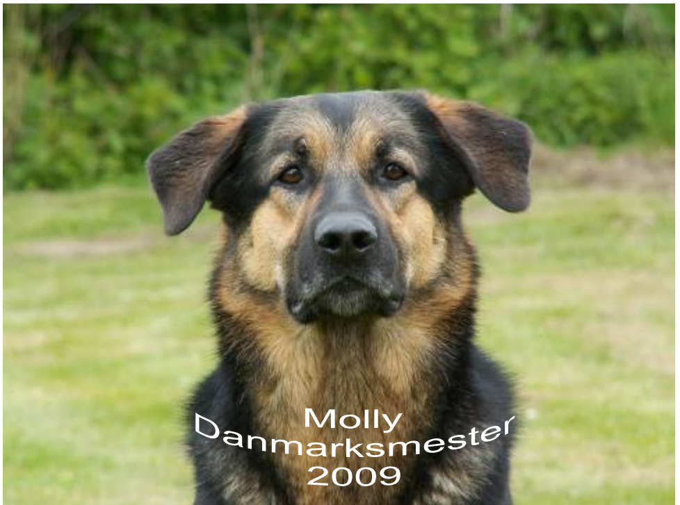
Molly Danmarksmester 2009